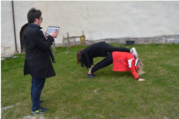
Med hjälp av två deltagare skall man efterlikna bilden ovan och ta en bild av detta.