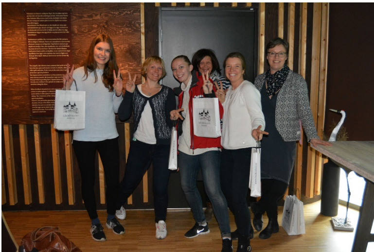
Rätt namn på laget hade laget "bäst" som också vann Loquiz tävlingen.

Väl åter i det vackra Viktoriahuset strax söder om slottet var det dags för prisutdelning. Laget "bäst" blev också bäst. Många skratt i samband med att vi visade de bilder som deltagande lag hade tagit. En prisutdelning avslutade det hela med trevliga artiklar från Läckös slottsbod.