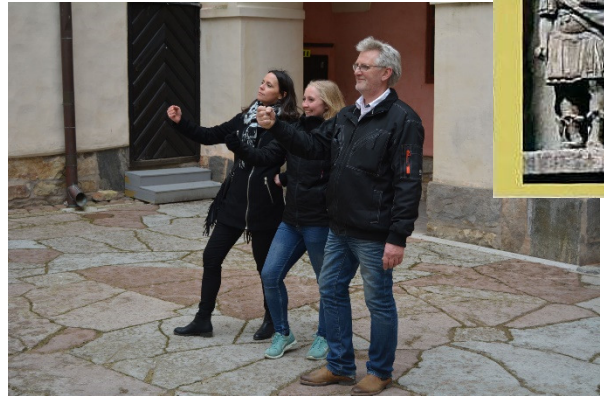
Efterlikna statyn efter den gamle greven på Läckö